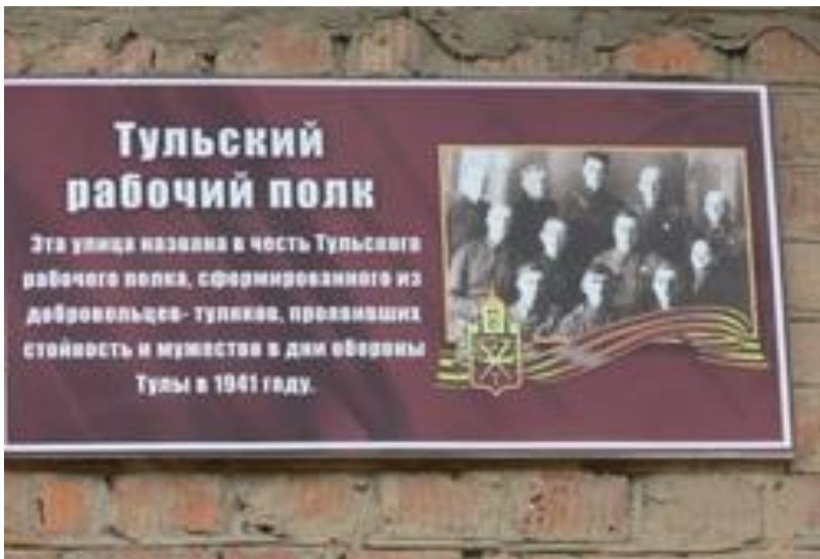
Улица Тульского рабочего полка и мемориальная доска в честь названия улицы на доме № 104

В Зареченском районе на улице Пузакова есть сквер Тульского рабочего полка, где в 1983 году была воздвигнута стела в честь подвига тульских ополченцев.