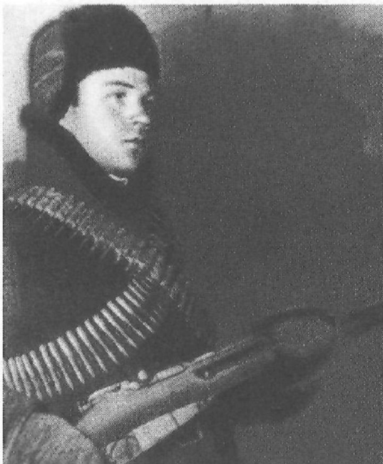
Боец Тульского рабочего полка

В конце октября 1941 года на Тульском направлении складывалась тревожная ситуация. Немецкая бронетехника со стороны Орла рвалась к Туле и было понятно, что силами только военнослужащих Красной армии отстоять город будет трудно.