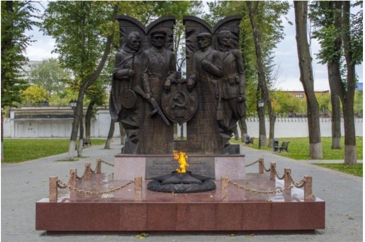
Памятник в Кремлевском саду

В деревне Пирово, рядом с поселком Басово, в 1979 г. установлен обелиск в память о подвиге юных разведчиков Тульского рабочего полка. В середине ноября выйдя на разведку в район Косой Горы, они были схвачены. После пыток и издевательств их расстреляли.