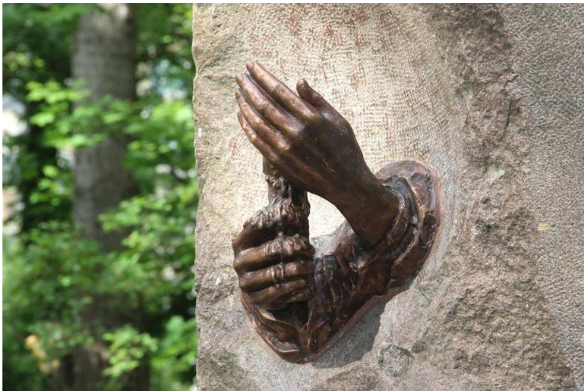
Скульптурная композиция «Свеча на ветру» в Рогожинском парке

Память о туляках, героически сражавшихся в составе Тульского рабочего полка хранит и Рогожинский парк. Здесь установлен памятный камень с посвящением погибшим здесь бойцам и скульптурной композицией «Свеча на ветру», а в 2019 г. открыт памятник Герою Советского Союза Григорию Агееву.