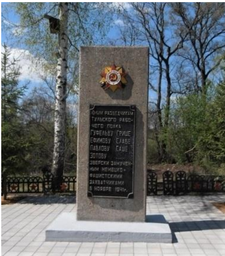
Памятная стела в деревне Пирово

В деревне Пирово, рядом с поселком Басово, в 1979 г. установлен обелиск в память о подвиге юных разведчиков Тульского рабочего полка. В середине ноября выйдя на разведку в район Косой Горы, они были схвачены. После пыток и издевательств их расстреляли.